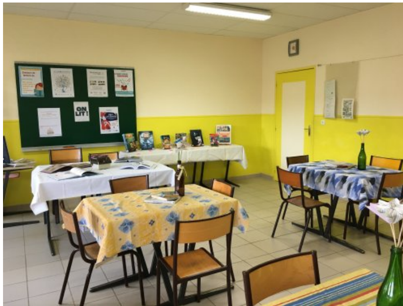
Salon de thé