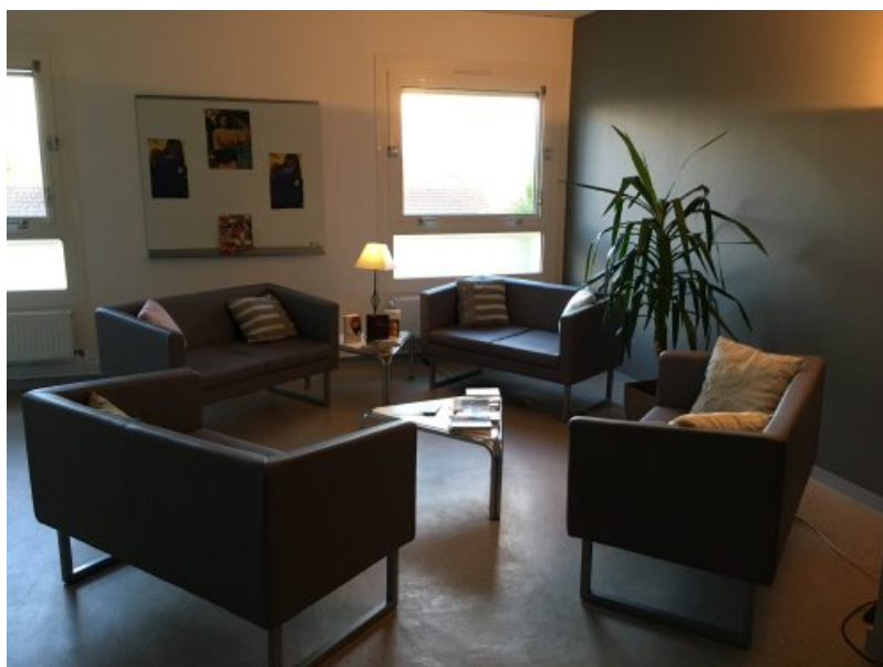
Salon de lecture ado-adultes

Les salles sont rebaptisées, transformées en salon de lecture, salon de thé et ateliers avec un objectif commun, accueillir le plus confortablement possible auditeurs, curieux, créatifs et gourmands.