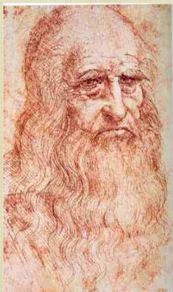
Léonard de Vinci (1452 - 1519)