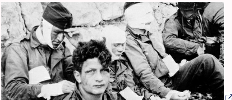
L'histoire du jour le plus long 🔗

► L'Histoire du jour le plus long 🔗 , documentaire de Sebastian Dehnhardt et Manfred Oldenburg.