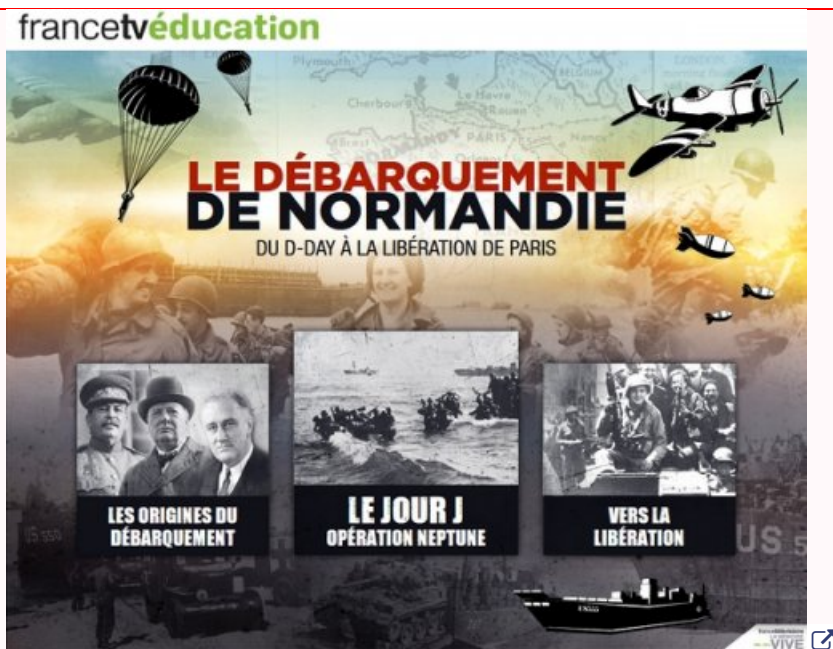
education.francetv.fr - 6 juin 1944 🔗