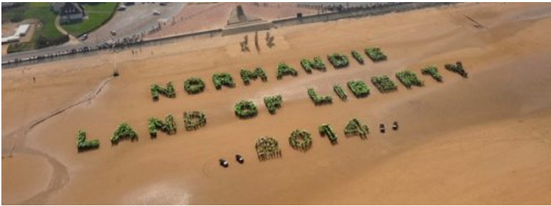
Normandie Land of Liberty 2014 - http://www.le70e-normandie.fr/