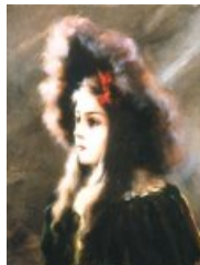
Yvonne à la fourrure

André Brouillet est également l'auteur du Paysan blessé (1886), de L'Ambulance de la Comédie-Française en 1870 (1891), du Vaccin du croup à l'hôpital Trousseau (1895), ainsi que des portraits de personnalités de l'époque, dont Joseph Babinski.