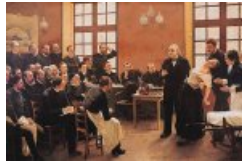
Le Dr Charcot à la Salpêtrière (1887)

Salpêtrière, aujourd'hui au musée de Nice : ce tableau fit sensation au Salon.