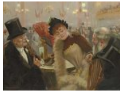
Suzanne et les vieux messieurs (1890)

En 1888, il peint L'amour aux champs et il obtient une médaille de bronze à l'Exposition Universelle de 1889. En 1890, il peint Suzanne et les vieux messieurs et trois ans plus tard Intimité et Madame H.G.T. ou Une parisienne .