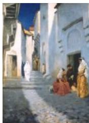
Une rue à Constantine

Influencé par son maître Jean-Léon Gérôme, André Brouillet s'adonne à la peinture orientaliste, se rendant à plusieurs reprises en Algérie en raison de son mariage avec une femme de l'élite juive constantinoise. Il peint ainsi la Noce Juive et Une rue à Constantine . Il voyagea également en Grèce ; il fit un portrait de la reine Olga de Grèce. En 1904, il est consacré par le journal Fémina comme le "Peintre de la femme". Il est surtout l'auteur de L'Exorcisme - Musiciens arabes chassant le djinn du corps d'un enfant peint en 1885, aujourd'hui à Reims, et qui lui vaut une seconde médaille,