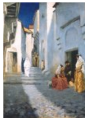
Une rue à Constantine

Influencé par son maître Jean-Léon Gérôme, André Brouillet s'adonne à la peinture orientaliste, se rendant à plusieurs reprises en Algérie en raison de son mariage avec une femme de l'élite juive constantinoise. Il peint ainsi la Noce Juive et Une rue à Constantine . Il voyagea également en Grèce ; il fit un portrait de la reine Olga de Grèce. En 1904, il est consacré par le journal Fémina comme le "Peintre de la femme". Il est surtout l'auteur de L'Exorcisme - Musiciens arabes chassant le djinn du corps d'un enfant peint en 1885, aujourd'hui à Reims, et qui lui vaut une seconde médaille,