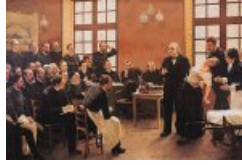
Le Dr Charcot à la Salpêtrière (1887)

Salpêtrière, aujourd'hui au musée de Nice : ce tableau fit sensation au Salon.