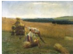
L'amour aux champs (1888)