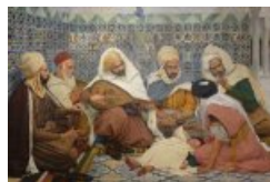
L'Exorcisme - Musiciens arabes chassant le djinn du corps d'un enfant (1884)

Dans les années 1902-1903, il participe aux peintures de la nouvelle Sorbonne à Paris, et peint, l'année suivante La vie simple . Il est fait officier de la légion d'honneur en 1906.