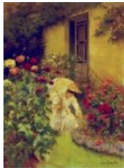
Dans le jardin