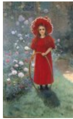
La petite fille en rouge (1895)