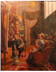
Intérieur d'atelier, musée de l'Échevinage, Saintes (1890)