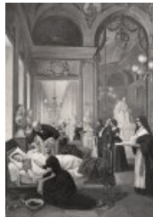
L'ambulance de la Comédie française en 1870 (gravure)

Pierre-André Brouillet est né le 1er Septembre 1857 à Saint-Laurent, commune de Charroux. Son père Pierre-Amédé, alors âgé de 31 ans, est un artiste. De sa mère, Elisabeth Lériget de Claurose, on sait peu de choses. En 1876, il est reçu à l'École Centrale puis rentre trois ans plus tard à l'École Nationale Supérieure des Beaux Arts. Le Salon accepte un de ses tableaux qui figurera sous les cimaises du Palais de l'Industrie.