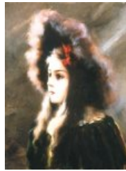
Yvonne à la fourrure

André Brouillet est également l'auteur du Paysan blessé (1886), de L'Ambulance de la Comédie-Française en 1870 (1891), du Vaccin du croup à l'hôpital Trousseau (1895), ainsi que des portraits de personnalités de l'époque, dont Joseph Babinski.