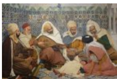
L'Exorcisme - Musiciens arabes chassant le djinn du corps d'un enfant (1884)

Dans les années 1902-1903, il participe aux peintures de la nouvelle Sorbonne à Paris, et peint, l'année suivante La vie simple . Il est fait officier de la légion d'honneur en 1906.