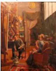
Intérieur d'atelier, musée de l'Échevinage, Saintes (1890)

Autres œuvres d'André Brouillet : Séries de portraits, Des paysages, Thème de l'Orientalisme.