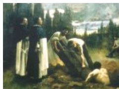
Violation du tombeau de l'évêque d'Urgel (1881)

Vers 1880, il débute sa carrière au Salon des Artistes français et en devient sociétaire en 1900. Au Salon de 1881, il reçoit une mention honorable et une bourse de voyage avec une grande toile, La Violation du tombeau de l'évêque d'Urgel par les Dominicains , maintenant au musée de Poitiers. L'année suivante, il peint Les femmes de Paris allant chercher du pain à Versailles , puis en 1883 Le Chantier , aujourd'hui l'un des joyaux du musée poitevin. Il reçoit d'ailleurs une médaille de 3e classe.