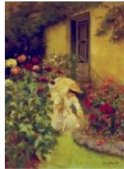
Dans le jardin