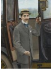
L'homme au canotier et au monocle, huile sur toile, 30 x 100 cm (1890)