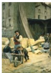
Le Chantier (1883)

En 1886, il peint Le Paysan blessé , aujourd'hui au musée de Grenoble et obtient une médaille de seconde classe. Alors professeur aux Beaux-Arts, il s'inscrit, l'année suivante, à l'atelier de Gérôme et peint Une leçon clinique à la