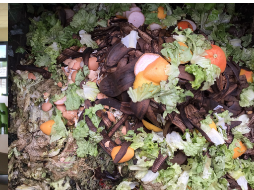
Les épluchures de fruits et de légumes du self sont déposées dans les deux composteurs du collège

A u self du collège, où 480 élèves déjeunent chaque jour, différentes actions sont mises en place pour limiter le gaspillage alimentaire et les déchets. Un gâchimètre a été installé pour le pain par exemple, ce qui a permis aux élèves de réaliser qu'ils en jetaient beaucoup, et qu'ils en prenaient trop. « Nous avons une cellule