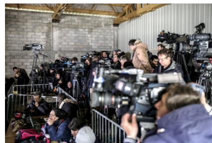
Crash de l'Airbus A320 : conférence de presse